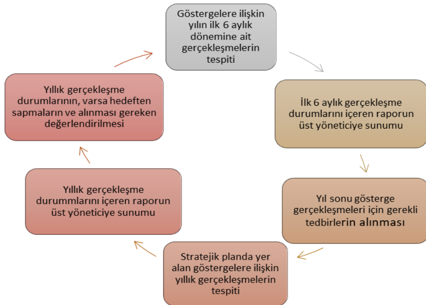
Tablo 24 İzleme ve Değerlendirme Modeli

Okulumuz Strateji Geliştirme Bölümü plan dönemi içerisinde ve her yılın sonunda “Çimento Çaydurt İlkokulu Stratejik Planı” uyarınca yürütülen faaliyetlerimizi, önceden belirttiğimiz performans göstergelerine göre hedef ve gerçekleşme durumu ile varsa meydana gelen sapmaların nedenlerini açıkladığımız, okulumuz hakkında genel ve mali bilgileri içeren izleme ve değerlendirme raporu hazırlanacaktır. İzleme raporları ve faaliyet raporları yıllık olarak hazırlanacaktır.